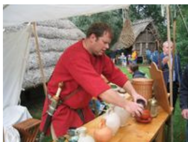
Met kann probiert werden.

An das leibliche Wohl ist ebenfalls wieder bestens gedacht. Brötchen und Fladen aus dem Lehmbackofen, Schwein vom Spieß sowie Suppe, gekocht im Kessel über einer offenen Feuerstelle, runden den Gang in die Geschichte ab. Eine Kostprobe Met lässt das Mahl vollkommen werden.